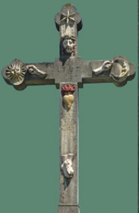
15. JH. HOLZKREUZ DAS BEI DER KIRCHE DER GEMEINSCHAFT SANKT MARTIN IN BEROMÜNSTER

Von Himmel und Fegefeuer, von Katholiken und Reformierten, von Bauern und Arbeitern.